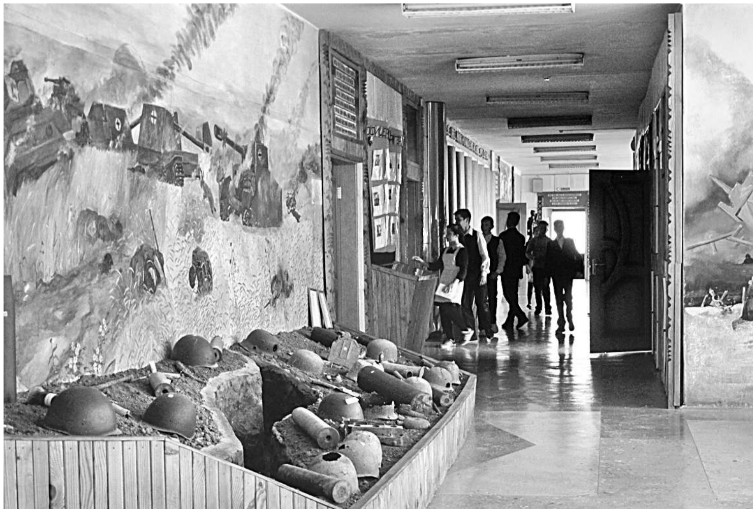
Школьный музей Великой Отечественной войны