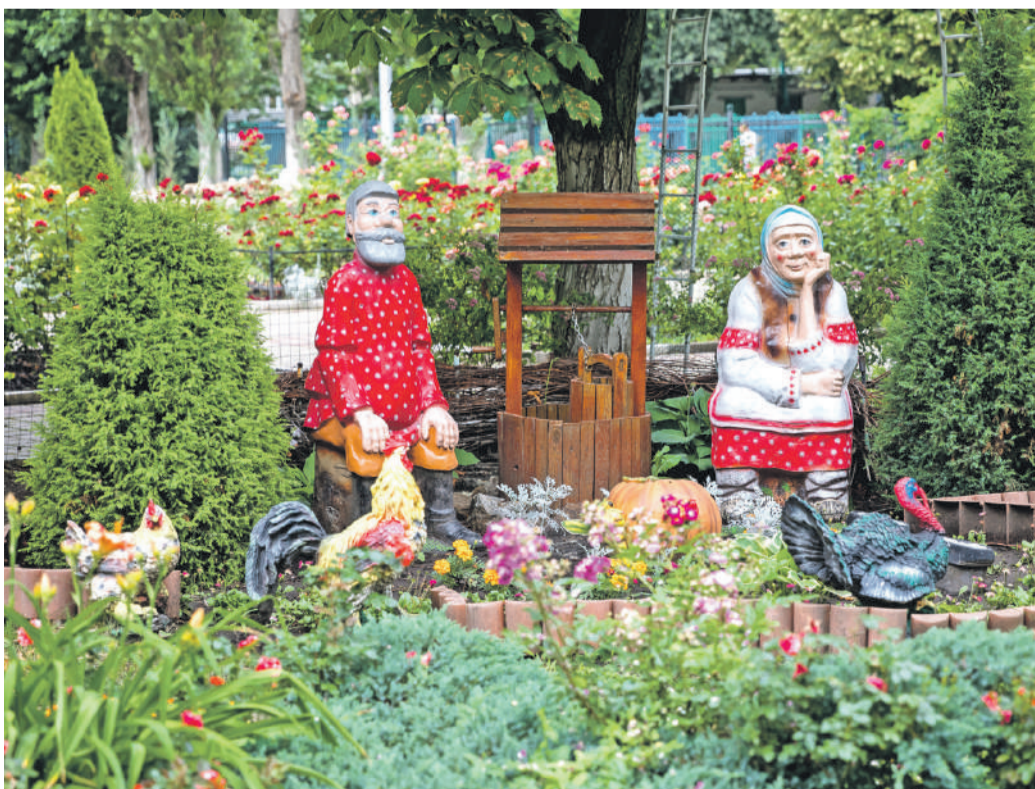
Школа № 41 г. Белгорода