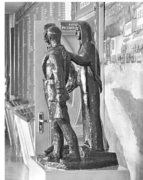
Школьный музей Великой Отечественной войны

Уверена в том, что в школе всегда ведущей и главной должна быть функция воспитания, ответственности за формирование человеческой личности. В детях необходимо формировать нравственные принципы, делая это незаметно и каждодневно. В нашей школе детей и педагогов связывают