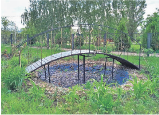
Уразовская школа № 2 Валуйского городского округа