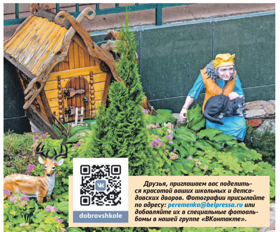
Школа № 41 г. Белгорода