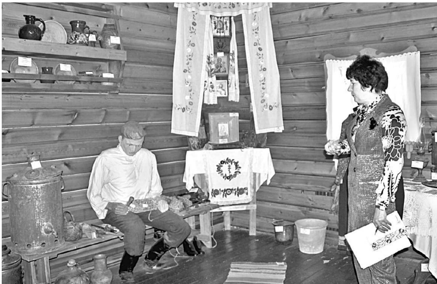
В школьном музее этнографии

НО ДАЖЕ САМОЕ КРАСИВОЕ, ПУСТЬ И ДОБРОЖЕЛАТЕЛЬНОЕ ОФОРМЛЕНИЕ МОЖЕТ СТАТЬ БЕСПОЛЕЗНЫМ, БЕЗДЕЙСТВЕННЫМ,