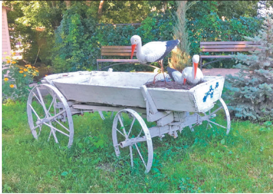
Центр образования № 1 г. Белгорода