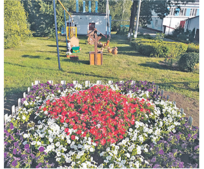
Старобезгинская школа Новооскольского городского округа