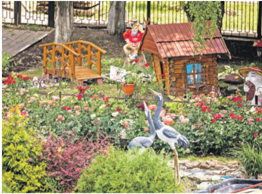
Школа № 41 г. Белгорода