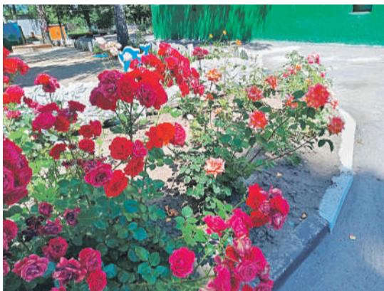
Детсад № 48 «Вишенка» г. Белгорода