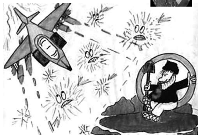
А вот таким детским «видением» браздов, ямщика и кибитки делятся друг с другом пользователи Интернета