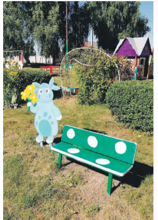
Детсад № 4 с. Алексеевка Корочанского района